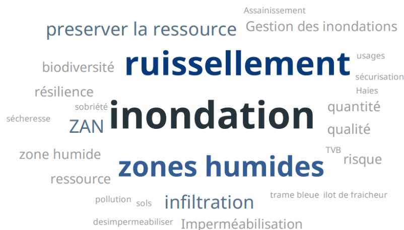
Table ronde 1 : Comment rendre les villes plus résilientes face au changement climatique ?

Nuage de mots constitué par les réponses des participants à la question posée en début de webinaire : « Pouvez-vous citer un défi à la croisée entre aménagement et eau sur votre territoire ? »