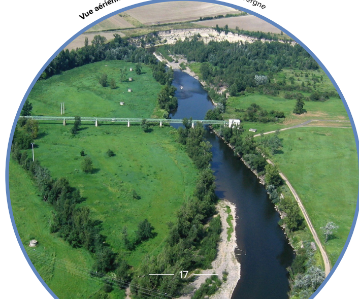
Vue aérienne de la zone de captage ©CEN Auvergne

Source : Agir pour la Loire et ses milieux naturels : expériences choisies, FCEN, 2022