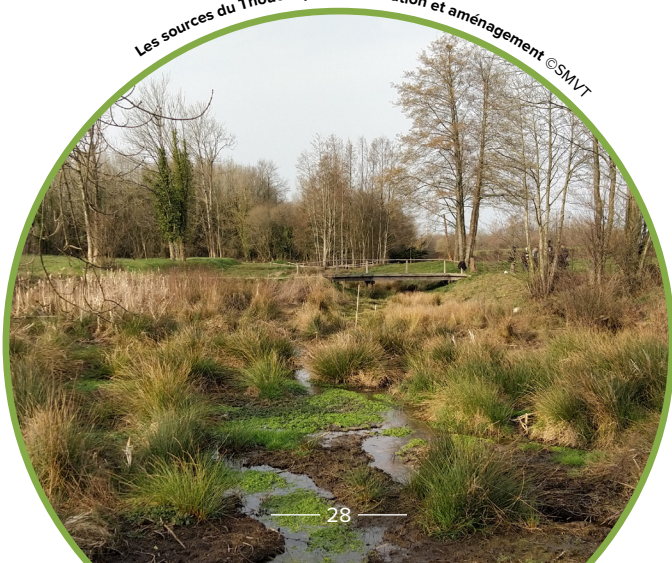
Les sources du Thouet après restauration et aménagement