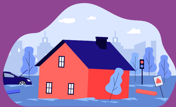
Mesures Naturelles de Rétention des eaux (MNRE)