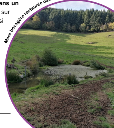
Mare bocagère restaurée dans la Loire ©FDC 42

Sources : agence de l'eau Loire-Bretagne ; FDC 42