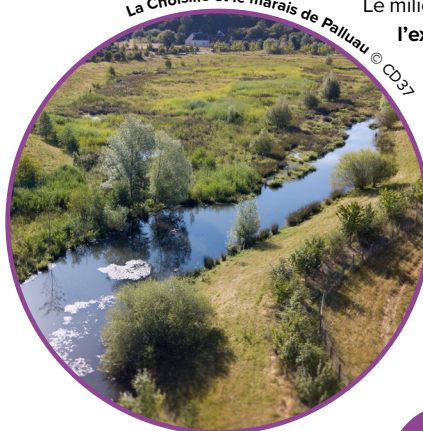
La Choisille et le marais de Palluau

Le milieu humide créé offre un espace pour l'expansion des crues de la Choisille. Il peut stocker jusqu'à 134 000 m 3 et limiter ainsi les risques d'inondation en aval. Lors de l'évènement exceptionnel de 2016, le marais a joué son rôle de rétention d'eau : aucune inondation n'a été constatée .