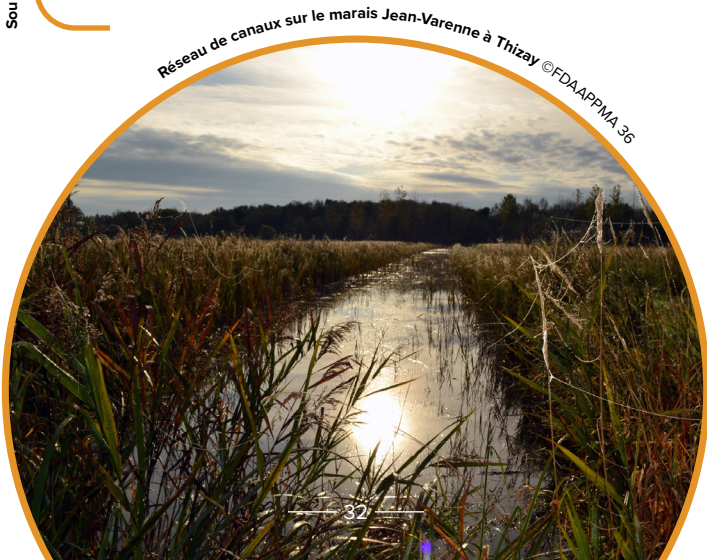
Réseau de canaux sur le marais Jean-Varenne à Thizay

Le marais abrite notamment 17 espèces végétales protégées ainsi qu'une richesse faunistique en termes de papillons, de libellules, d'oiseaux ou encore de mollusques . Les noues sont devenues des frayères dans des zones d'élargissement et servent aussi de lieux de ponte pour les amphibiens ou encore les libellules .