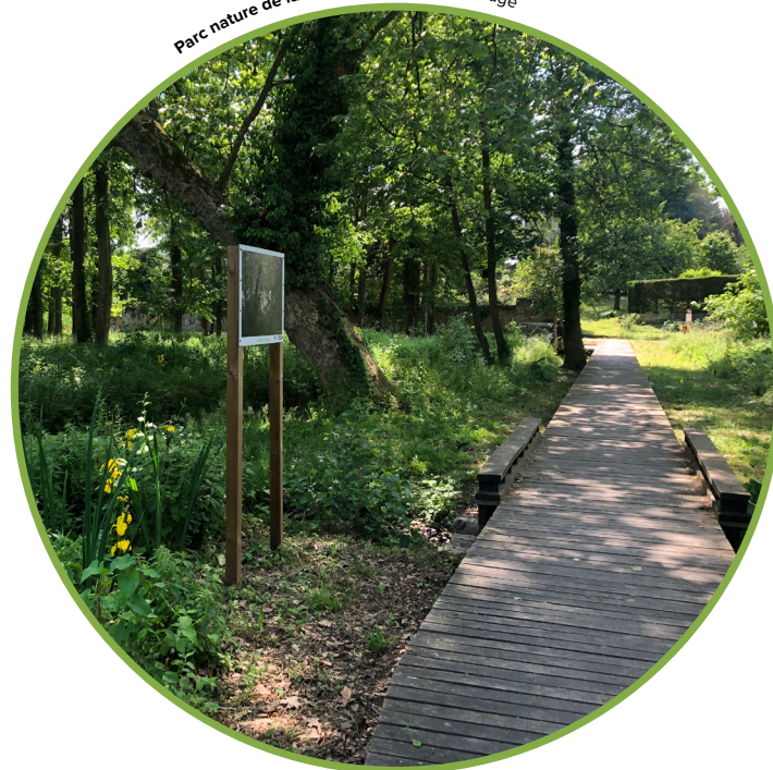
Parc nature de la Passerelle