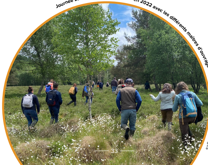
Journée zones humides organisée en 2022 avec les différents maîtres d'ouvrage du contrat