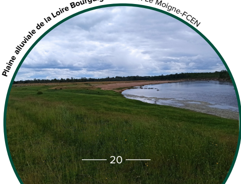
Plaine alluviale de la Loire Bourguignonne

Aussi, pour rendre un service d'écrêtement équivalent à celui de la plaine alluviale de la Loire Bourguignonne, il faudrait investir entre 150 et 840 millions d'euros (réf. 2010) dans la construction d'un barrage, auxquels s'ajouteraient les coûts annuels d'exploitation.