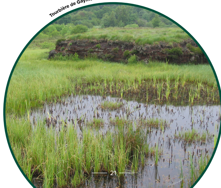
Tourbière de Gayme ©F. Muller

Source : MATHIAS Y. & al., 2022. The basis of a carbon credits certification for restoration & low carbon farming on peatlands in Northwest Europe. Programme Interreg NWE Carbon Connects, 60p.