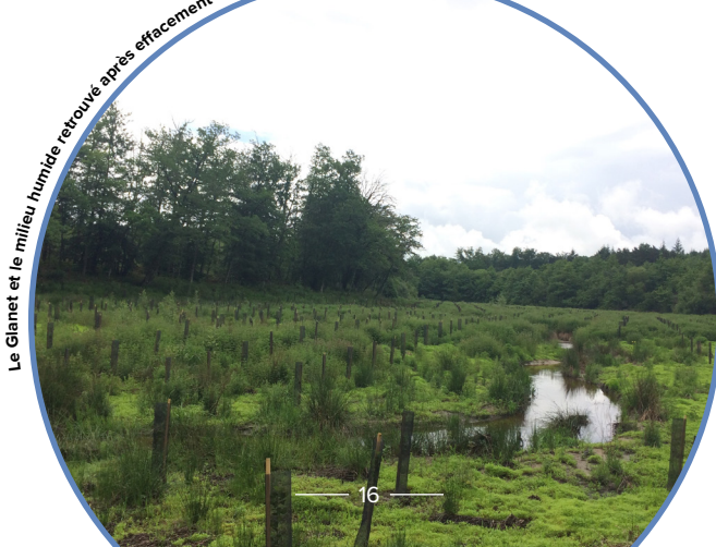
Le Glanet et le milieu humide retrouvé après effacement de l'étang de Peyruche ©Y. Brizard-SABV

Sources : Fiche retour d'expérience du réseau des TMR ; SABV