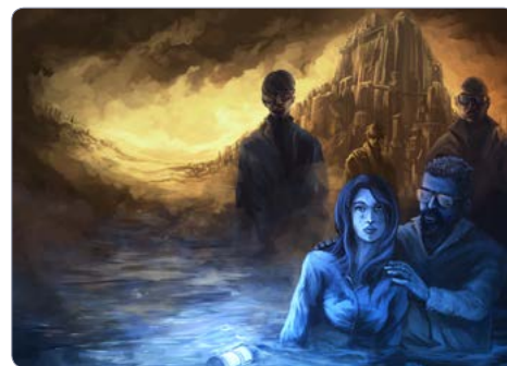
Illustration de la pièce par Yohan Monange

Cette oeuvre a vocation à contribuer à la sensibilisation aux risques d'inondation d'adolescents, de jeunes adultes et de leurs parents. Elle les invite à réfléchir sur l'impact des décisions politiques et économiques sur l'environnement, ainsi qu'à la responsabilité individuelle et collective en matière de prévention.