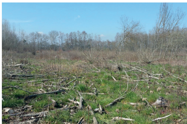
Peupleraie des Pinoux avant les travaux de restauration en 2016