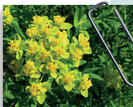
Euphorbe des marais ( Euphorbia palustris )

Les deux anciennes parcelles agricoles ont montré une amélioration notable de leur biodiversité.