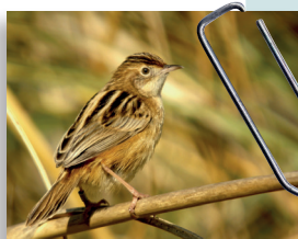
Cisticole des joncs ( Cisticola juncidis )