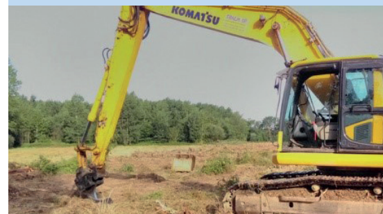
2 Rognage des souches pour lutter contre la reprise du boisement.