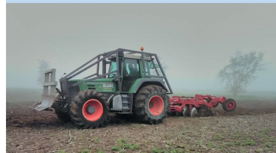
4 Labour de la parcelle pour dédier cette surface à l'agriculture : fauche et pâturage de regain.