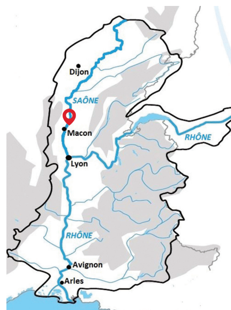
Localisation des prairies de Manziat

« Les vastes ensembles de prairies à très forte valeur écologique ne peuvent être préservés durablement qu'en maintenant l'élevage. Les difficultés économiques de cette filière ont eu des conséquences sur ces milieux naturels (apparition de haies, voire bois) et des impacts sur l'avifaune. L'intervention des pouvoirs publics sur la reconversion en prairies de bois spontanés ou plantés à faible valeur économique peut répondre aux besoins des agriculteurs et aux enjeux relatifs à l'eau et à la biodiversité. »