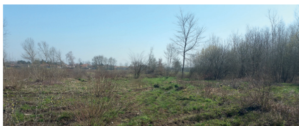
Peupleraie des Pinoux avant restauration en 2016

L'entretien insuffisant des deux peupleraies du secteur des Pinoux et de la Culaz à Manziat les ont rendues difficilement valorisables économiquement, la commune a alors choisi de confier l'usage de ces parcelles au Conservatoire d'espaces naturels. Le choix de gestion s'est porté vers une reconversion en prairie afin de retrouver des espaces ouverts à dédier à l'agriculture et diminuer les risques de prédation des oiseaux nicheurs.