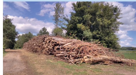
3 Stockage des troncs de peupliers avant vente pour une valorisation économique.