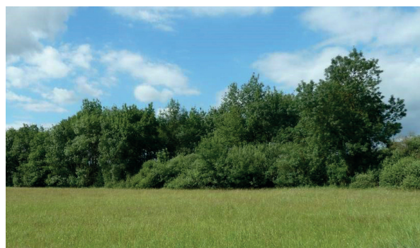
Boisement spontané d'une ancienne parcelle agricole dans le secteur du Passoir avant restauration en 2013

Les parcelles concernées par le projet se trouvent dans un ensemble prairial du Val de Saône particulièrement favorable à l'avifaune remarquable. L'abandon des pratiques agricoles d'élevage sur les secteurs du Grand Carré à Saint-Bénigne et du Passoir à Manziat, a entraîné la colonisation spontanée par les ligneux. Cela a réduit les habitats propices à la nidification et favorisé l'implantation de prédateurs. Avant les travaux, aucune espèce remarquable n'a été trouvée sur ces secteurs. Les opérations de reconversion de ces milieux boisés ont pour objectif de favoriser la biodiversité floristique et faunistique.