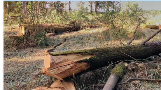
1 Abattage d'arbres des peupleraies.