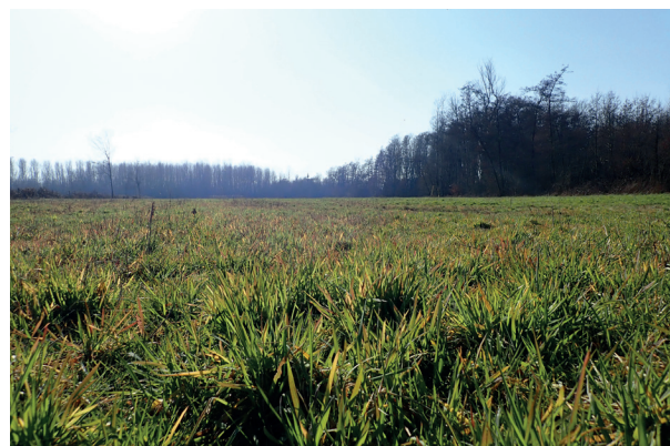
Prairie humide issue de la conversion de la peupleraie des Pinoux après les travaux de restauration en 2019