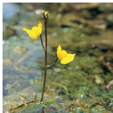
Utriculaire commune ( Utricularia vulgaris )