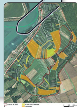
Bilan foncier de 2017

Une surface de 27,8 ha est maîtrisée par le Conservatoire, soit 23% de la surface totale .