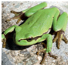
Rainette verte ( Hyla arborea )