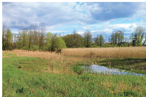
Ancienne peupleraie convertie en prairie humide avec un réseau de mares et une roselière