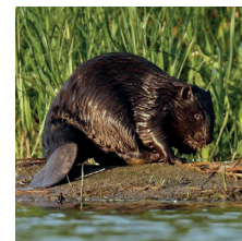
Castor d'Europe ( Castor fiber )