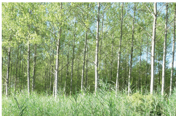
Peupleraie avant les travaux d'abattage