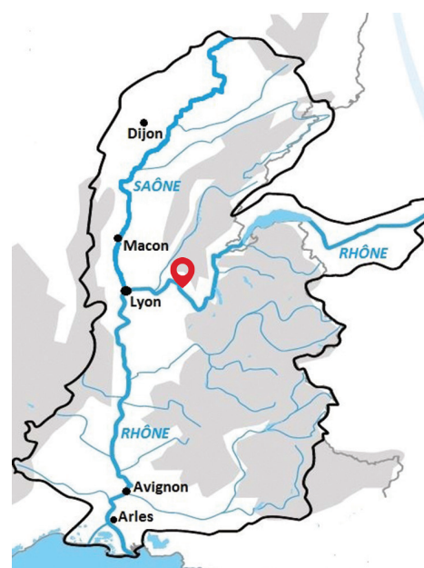
Localisation des anciens méandres du Rhône à Serrières-de-Briord

Corine Trentin, chargée de missions Conservatoire d'espaces naturels Rhône-Alpes