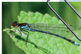
Naiade aux yeux rouges ( Erythromma najas )

Les deux suivis d'odonates réalisés en 2011 et 2016 ont permis de recenser au total 36 espèces différentes , dont 5 considérées comme remarquables .