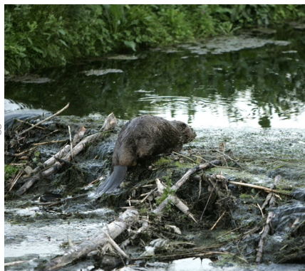
Le castor et son barrage