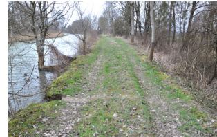
La digue avec à gauche le canal et à droite la zone humide