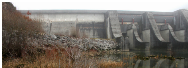
Ouvrage hydroélectrique, difficilement franchissable par le castor