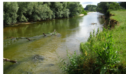
Cours d'eau typique occupé par le castor

Enfin, si les berges sont trop meubles, le discret terrier devient alors une forteresse de bois avec hutte et auvent.