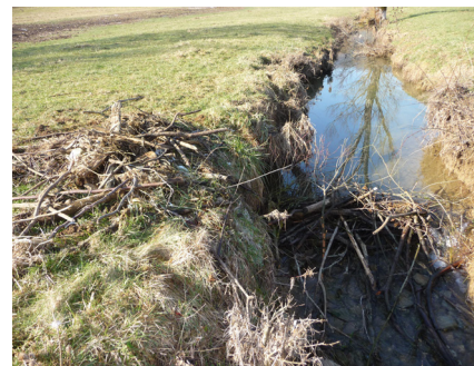
Conflit autour d'un barrage régulièrement détruit... et réparé

Ces préjudices, généralement négligeables, trouvent souvent leur origine dans des pratiques humaines ayant oublié que le castor fait partie intégrante de la biodiversité des cours d'eau, au même titre que l'aulne et la truite... Ce castor qui partage avec l'homme et l'éléphant le titre suprême d'espèce « ingénieur ».