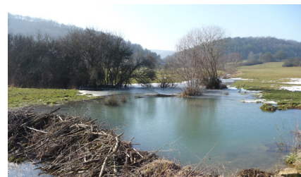
Barrage et retenue d'eau créés par le castor