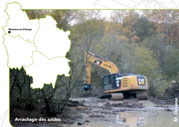
Arrachage des saules