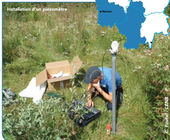
Installation d'un piézomètre

Il est conseillé d'effectuer un passage de contrôle quelques semaines après pour vérifier que le piézomètre enregistre bien les données.