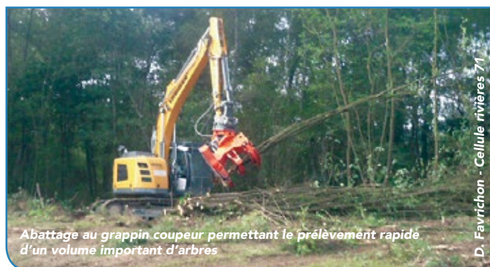
Abattage au grappin coupeur permettant le prélèvement rapide d'un volume important d'arbres