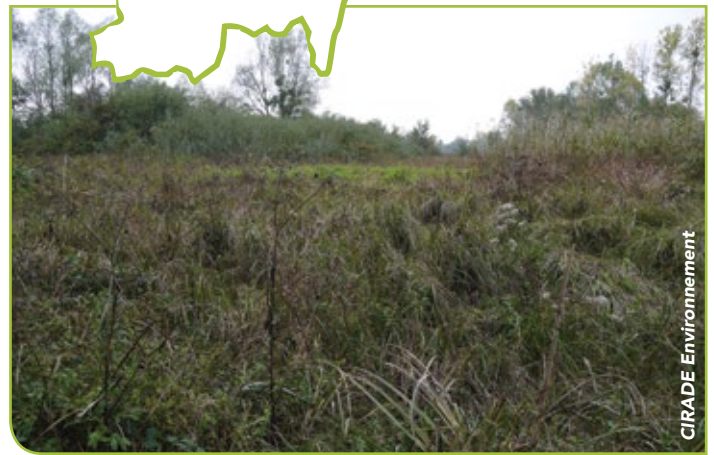
Le Pré marin à Dommartin-lès-Cuiseaux avant et après les travaux de broyage.