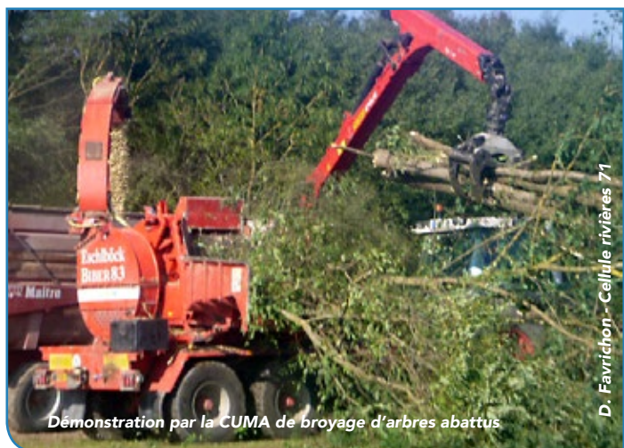
Démonstration par la CUMA de broyage d'arbres abattus

Outre les aspects techniques, le guide rappelle les aspects réglementaires (interdiction de taille et de coupe entre le 1 er avril et le 31 juillet) et les mesures préventives à privilégier quant à la gestion des bois de berges de rivière.