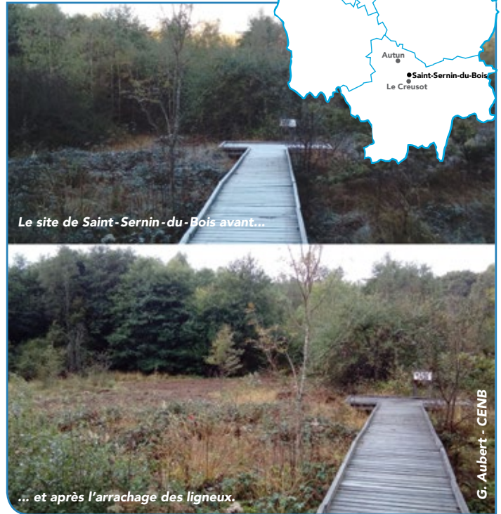
Le site de Saint-Sernin-du-Bois avant...

Animatrice de la Cellule Milieux humides Conservatoire d'espaces naturels de Bourgogne