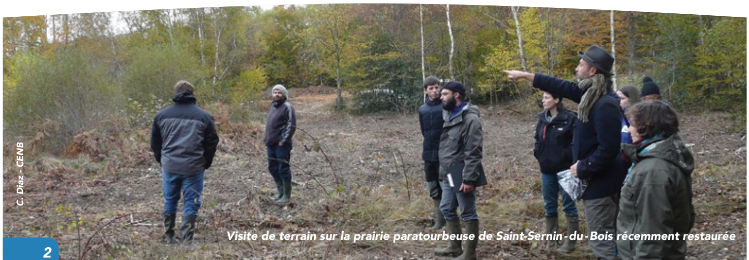
Visite de terrain sur la prairie paratourbeuse de Saint-Sernin-du-Bois récemment restaurée

Chargé de projet Conservatoire d'espaces naturels de Bourgogne