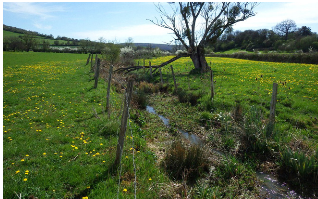
Mise en défens des berges - Nièvre (Rivières Nièvre)