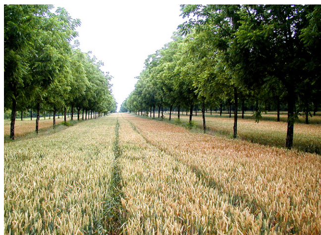
Agroforesterie - Céréales et noyers - Charente-Maritime (Association Agroforesterie)