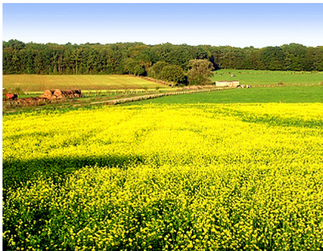
Culture intermédiaire piège à nitrates (CIPAN) qui permet de réduire le lessivage des nitrates, l'érosion des sols - CIPAN de colza sur l'exploitation de Jacques Poinçot (Meurthe-et-Moselle)