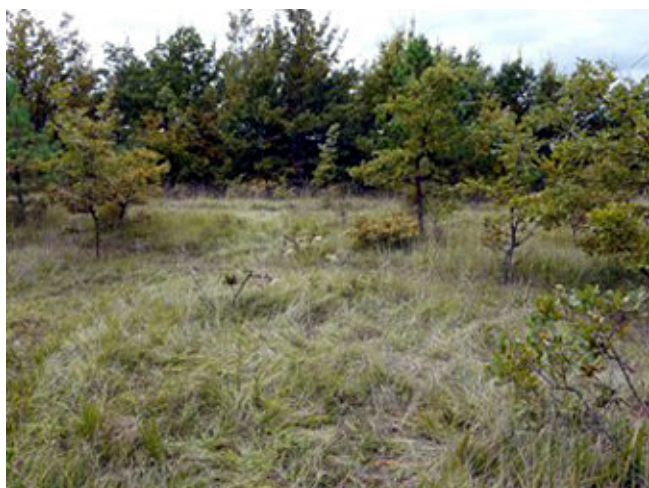
Prairie en voie d'enrichissement - Vienne (Lycée Agrotec)