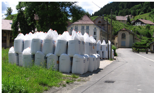
La pollution par les nitrates (CPEPESC)