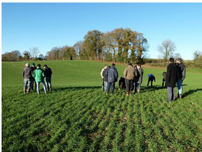
Technique de conservation des sols par labour peu profond - Groupement d'intérêt écologique et économique (GIEE) de Boussac (Creuse)