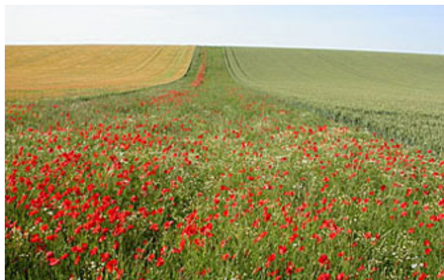
Jachère spontanée - Saint-Jean-sur-Tourbe