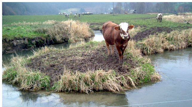
Piétinement des berges par les animaux par absence de clôture (s2rivieres)