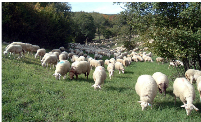
Pâturage de regain - Ain (D. et C. Roup)