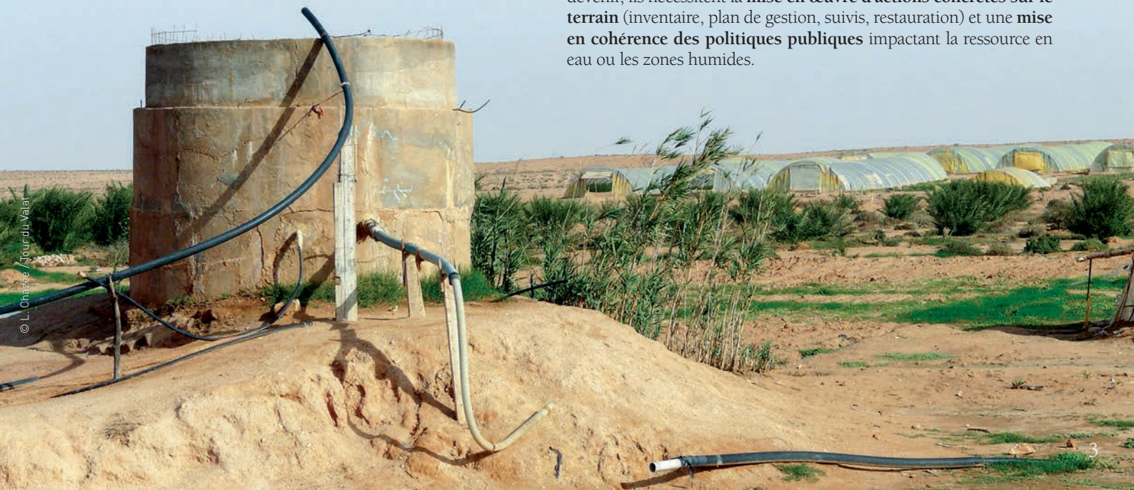
▲ Agriculture irriguée en zone aride, Algérie