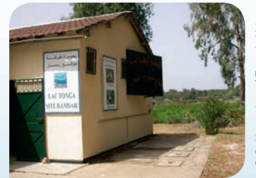
▲ Site Ramsar du lac Tonga, Algérie

Environ 30 % des pays de la région ont à la fois une politique pour les zones humides et un comité national spécifique. Mais en réalité, dans la plupart des pays, ces instruments ne sont pas encore très effectifs. Pour le devenir, ils nécessitent la mise en œuvre d'actions concrètes sur le terrain (inventaire, plan de gestion, suivis, restauration) et une mise en cohérence des politiques publiques impactant la ressource en eau ou les zones humides.