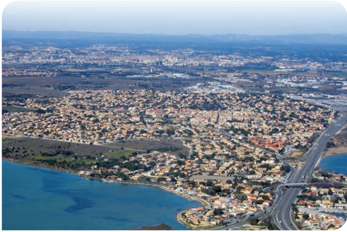
▲ Urbanisation en bordure de zone humide méditerranéenne (agglomération de Montpellier, France)

●●● Le changement climatique a également un impact croissant, amplifiant les sécheresses. Le niveau de la mer Méditerranée a augmenté de 22 cm au cours du 20 ème siècle, affectant les zones humides littorales. Cette tendance va s'aggraver.