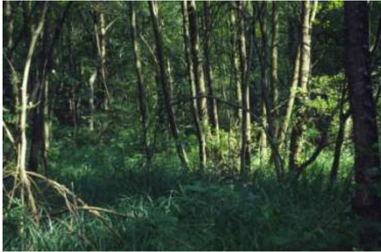
Zones humides boisées : bandes boisées des rives et boisements alluviaux