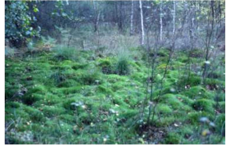
Tourbières, zones tourbeuses et tourbières boisées