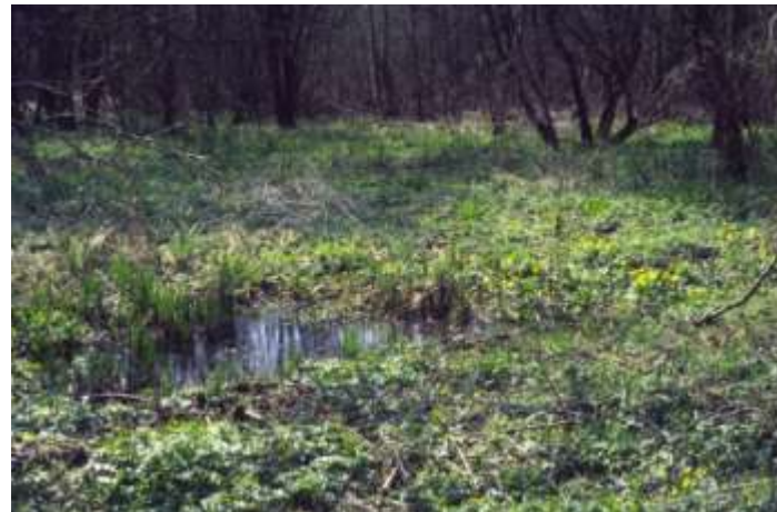
Marais et landes humides de plaines et plateaux