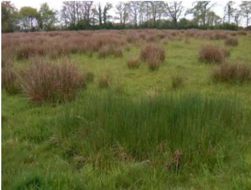
Zones humides de bas-fond en tête de bassin versant