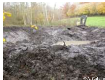
Création de plans d'eau