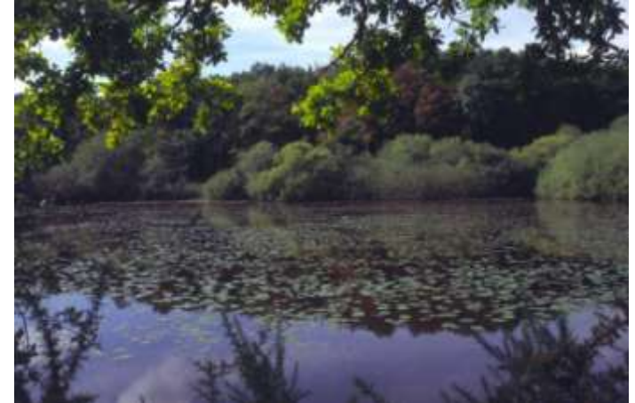
Plans d'eau, étangs et leurs bordures