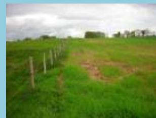
Artificialisation de la végétation

A identifier à la tarière sur les secteurs à enjeu d'urbanisation