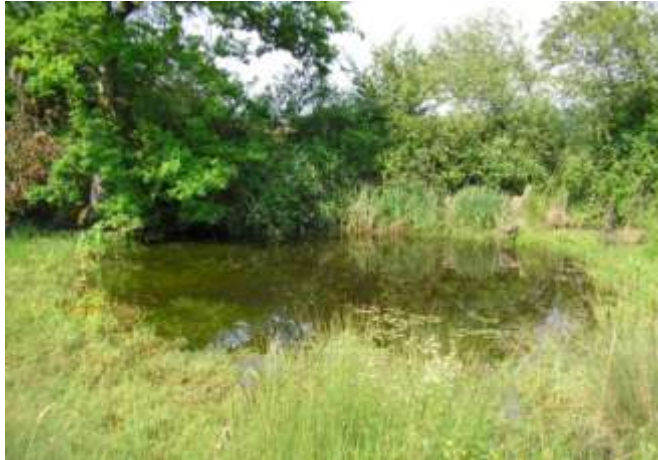
Mares et leurs bordures