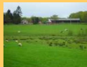
Prairie humide eutrophe

Zones humides à identifier sur l'ensemble de la commune