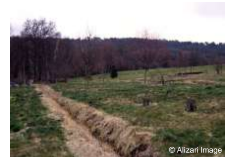
Drainage d'une tourbière