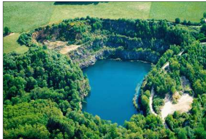
Zones humides artificielles