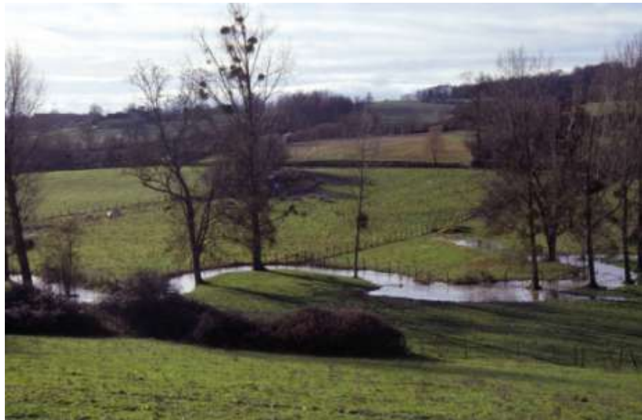
Zones humides en bordures de cours d'eau