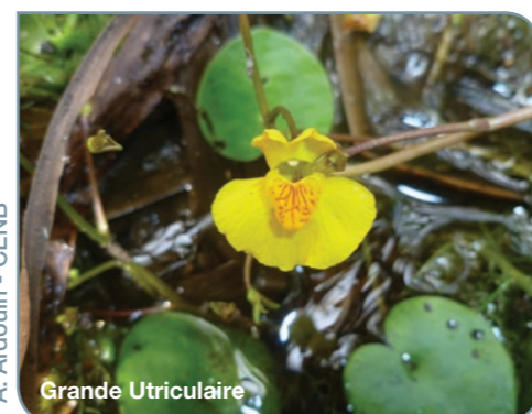
A. Ardouin - CENB