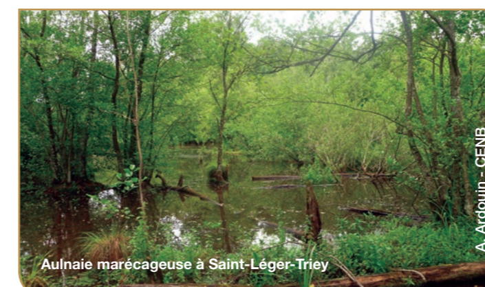
Aulnaie marécageuse à Saint-Léger-Triey