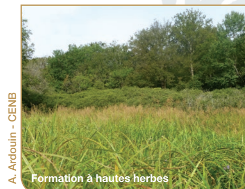
A. Ardouin - CENB