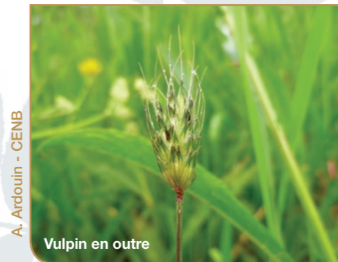
A. Ardouin - CENB