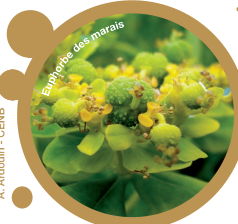
A. Ardouin - CENB

Fond cartographique : IGN Scan 25 Sources : BD Carthage, 2011 EPTB Saône et Doubs, 2011 - CEN Bourgogne, 2013 Conception : CEN Bourgogne, 2013