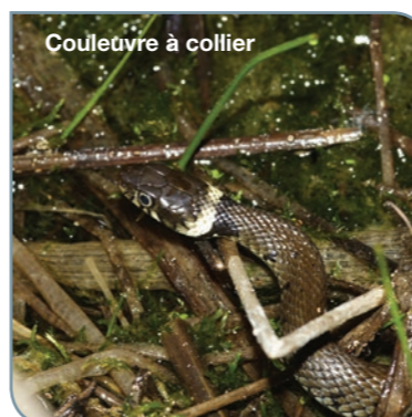
C. Foutel - CENB