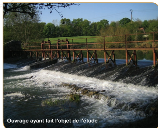
Ouvrage ayant fait l'objet de l'étude