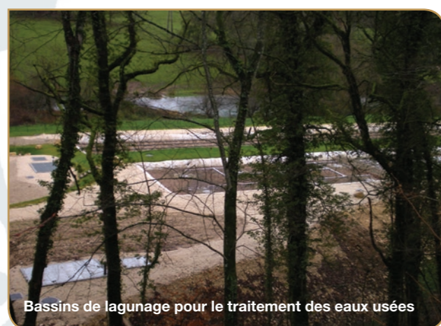
Bassins de lagunage pour le traitement des eaux usées