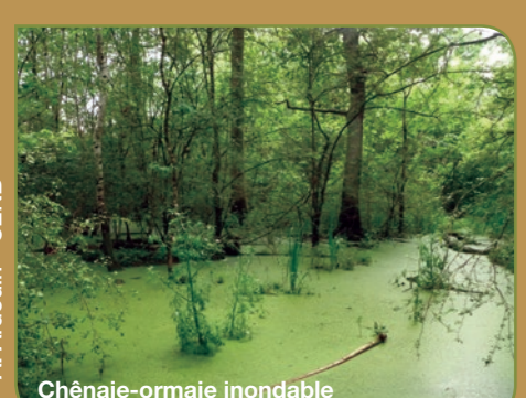
A. Ardouin - CENB