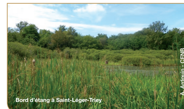
Bord d'étang à Saint-Léger-Triey