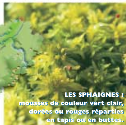
LES SPHAIGNES : mousses de couleur vert clair, dorées ou rouges réparties en tapis ou en buttes.