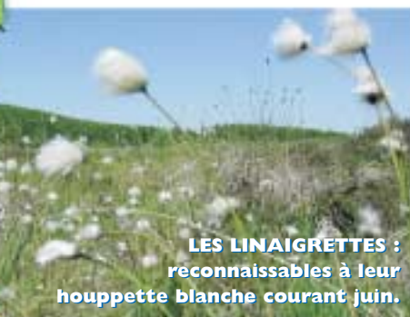
LES LINAIGRETTES : reconnaissables à leur houpette blanche courant juin.