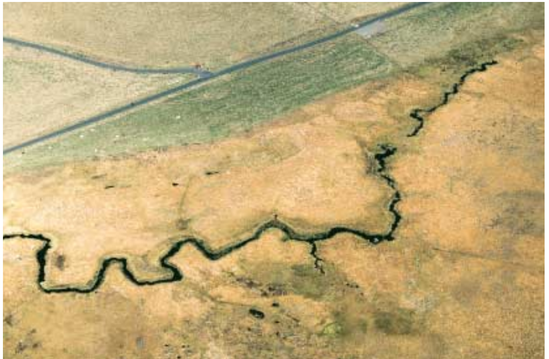
Naissance d'un cours d'eau au cœur d'une tourbière.

Par la préservation et la valorisation des richesses naturelles