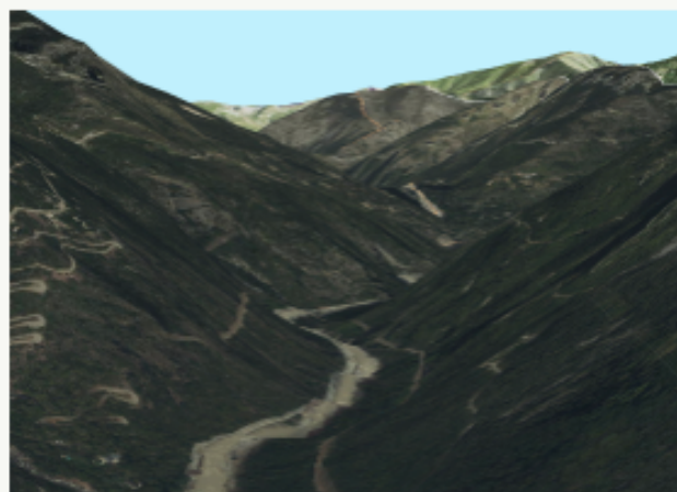
VISUALISER LES DONNÉES EN 3D