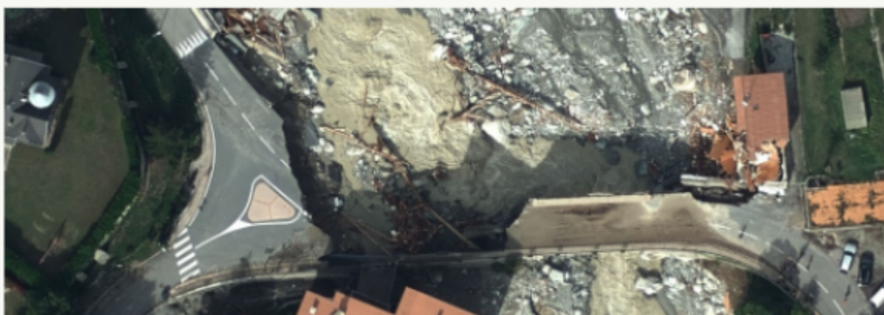
COMPARER AVEC LES IMAGES HISTORIQUES

Le 2 octobre 2020, des intempéries d'une rare violence ont frappé les Alpes-Maritimes. Dès le 5 octobre, un avion de l'IGN survolait les zones sinistrées pour effectuer des prises de vues aériennes très haute résolution. L'IGN met ici à disposition les plus de 2 000 images captées, d'une importance majeure dans l'évaluation des dégâts et la reconstruction sur place.